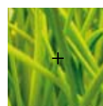
Image à fournir dans son intégralité (9X9 cm) SANS REPÈRES laisser une croix de centrage