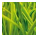
Image à fournir dans son intégralité (50X50 Mm) SANS REPÈRES laisser une croix de centrage